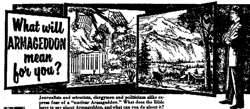
Journalists and scientists, clergymen and politicians alike express fear of a "nuclear Armageddon." What does the Bible have to say about Armageddon, and what can you do about it?

2) На каком основании Общество Сторожевой Башни называет его лжепророком?